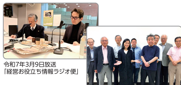
令和7年3月9日放送 「経営お役立ち情報ラジオ便」