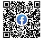
N-NETSの活動や 情報をリアルに提供

当法人は、新しい社会づくりをめざして市民活動を展開 する小規模事業者や特定非営利活動法人に対して創業 支援及び経営力向上、改善向上等の支援に関する事業 を行い、社会全体の利益の増進に寄与することを目的 にしています。